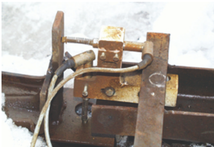
Wegaufnehmer für die horizontale und vertikale Wegmess-Komponente im Gleisbogen