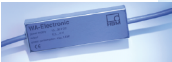
WA-Electronic: zwischen Wegaufnehmer und Messverstärker

Das Auswerten erfolgte mit der HBM-Software catman®. Um die preiswerten Achtkanal-Einschübe ML801/AP801 mit Spannungseingang einsetzen zu können, mussten die Signale der passiven induktiven Wegaufnehmer auf ein Gleichspannungssignal von 0,5 bis 10V, was 0 bis 10mm entspricht, konvertiert werden. Die neue WA-Kabelelektronik machte dies auf einfache Weise möglich.