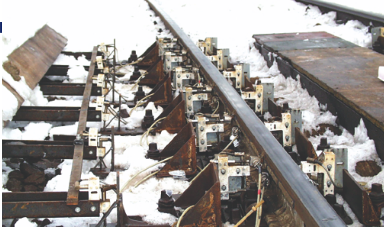
Anordnung der Aufnehmer am Gleisbogen