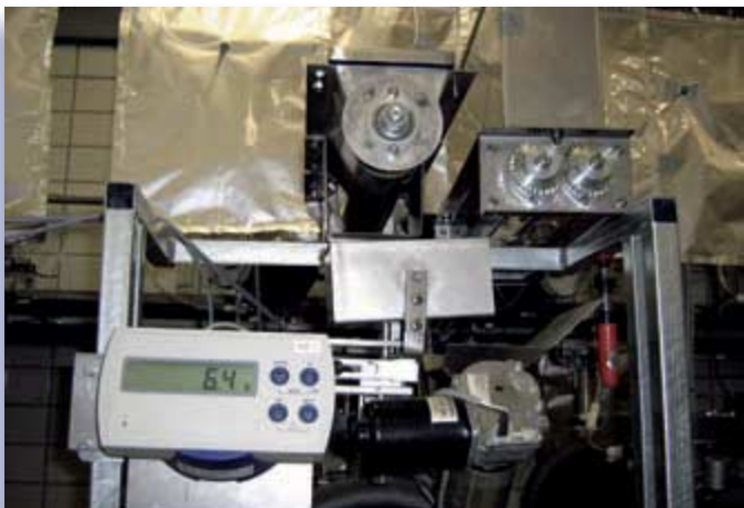
Abb. 3: Der HBM-Wägeindikator WE2107 steuert die Dosier Routinen