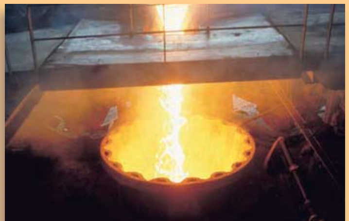
Abb.: Häufig werden Wägezellen außergewöhnlich hohen Temperaturen ausgesetzt