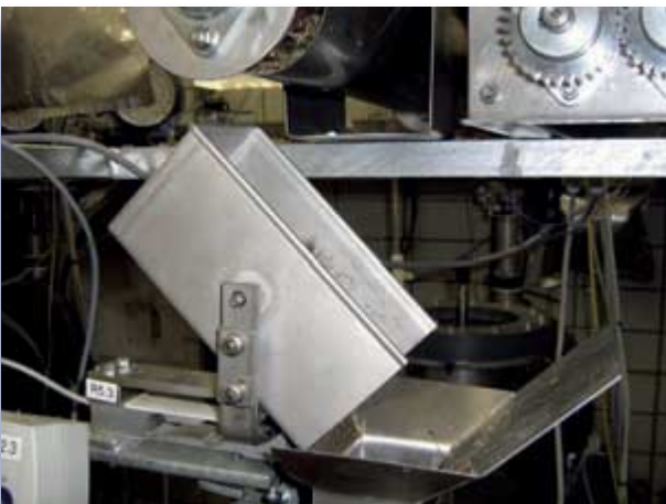
Abb. 2: Wiegeschale beim Einbringen von Substrat