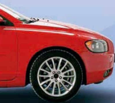
Abb. 5: Volvo C70-Cabriolet während der Dachbewegung