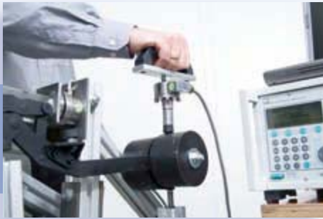
Abb.1-3: Messaufbau am Komponentenprüfstand für das Hardtop