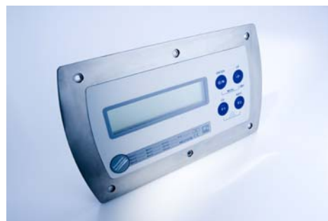
Fig. 2: O novo indicador de pesagem WE2107M em versão para montagem plana

De outro lado, o WE2107 provê interfaces e um teclado para uma fácil adaptação individual à processos de pesagem e dosagem. O software-painel incluso traz consigo muitas opções de filtros e processos para uso imediato.