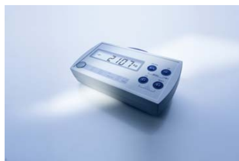
Fig. 3: O novo indicador de pesagem WE2107 em sua versão padrão para montagem em paredes, pilares ou superfícies de trabalho

Em empresas onde diversas tarefas de pesagem e dosagem precisam ser executadas o WE2107 é capaz de substituir os vários e distintos indicadores e eletrônicas que seriam, sem o mesmo, necessários. Isto maximiza a utilização e compatibilidade, estando conforme às necessidades diárias de produção de uma empresa flexível.