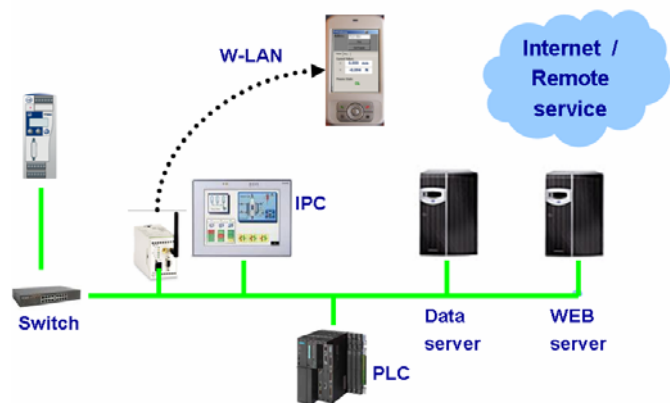
Fig. : la structure