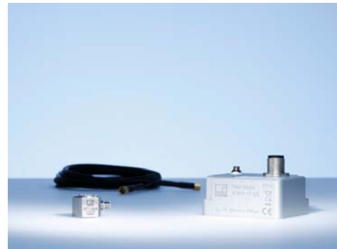
Fig. : capteur piézo HBM avec amplificateur de charge

Le contrôleur d'essai EASYswitch permet de mesurer les courbes de mesure avec une résolution exacte de 20 bits. Le calcul de plusieurs courbes d'essai en début de contrôle garantit une approche systématique, dans le cadre de laquelle la réduction au minimum des influences mécaniques de la structure de mesure joue un rôle important.