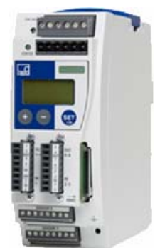
Fig. : contrôleur de process EASYswitch

Les courbes de mesure sont acquises en temps réel par l'EASYswitch, qui détermine pour chaque commutation ou fermeture jusqu'à 9 valeurs minimales et maximales locales. L'haptique et la fonction de commutation de l'élément de contrôle peuvent être déterminées avec précision d'après la localisation et la grandeur de ces valeurs caractéristiques. Deux amplificateurs de mesure fonctionnant en parallèle permettent l'exploitation de capteurs de déplacement-force, couple-angle de rotation courants.