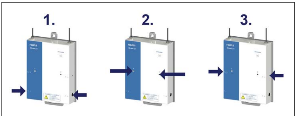
Abb. 2.7 Abfolge der Schritte beim Entriegeln

Für diese Kontrolle ist es am einfachsten, den Sensor so zu konfigurieren, dass der Neigungswert gemessen wird. Wenn die verfügbare Ausrüstung keine Software für eine automatische Ausführung umfasst, kann die Kontrolle aber auch manuell durch direkte Beobachtung der absoluten Wellenlängenwerte erfolgen.