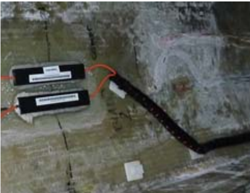
Abb. 2.14 Mit Wellrohren geschütztes Kabel

Für die Führung der längeren Verbindungskabel zum Anschluss an den Interrogator können auch Wellrohre aus Kunststoff verwendet werden (Abb. 2.14).