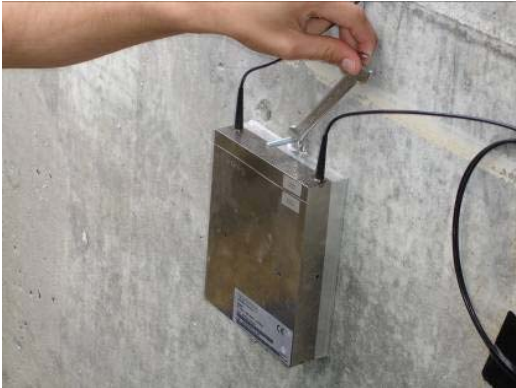
Abb. 2.11 Festziehen der Sechskantmutter