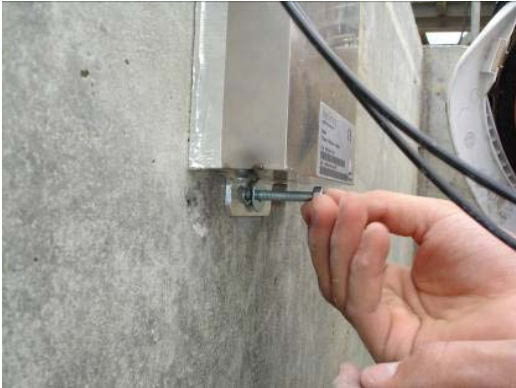
Fig. 2.5 Installation des rondelles et écrous hexagonaux