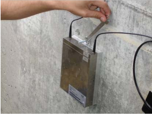
Fig. 2.11 Fixation des écrous hexagonaux