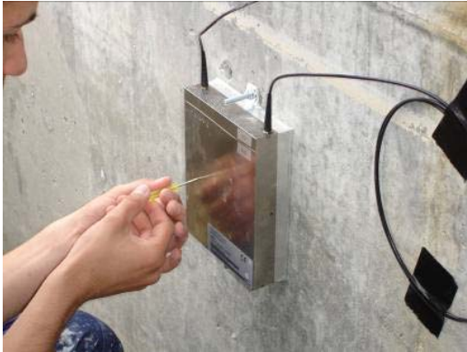
Fig. 2.9 Vis de verrouillage en façade (numéro "2")

Les vis de verrouillage marquées du chiffre "2" sont les vis de verrouillage en façade. Ces vis ne peuvent pas être retirées.