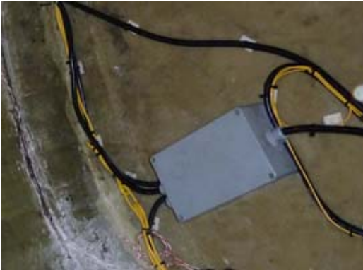
Fig. 2.15 Boîtiers de protection pour l'excédent de câble et les connexions

L'excédent de câble doit être enroulé et stocké dans un boîtier IP approprié afin de pouvoir être utilisé en cas de rénovation du réseau (Fig. 2.15).