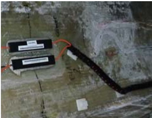
Fig. 2.14 Câble protégé par des tuyaux ondulés

Il est également possible d'utiliser des tuyaux en plastique ondulé pour acheminer les câbles de dérivation plus longs qui seront ensuite raccordés à l'interrogateur (Fig. 2.14).