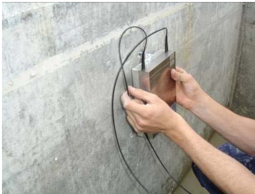
Fig. 2.4 Mise en place du capteur sur les supports

L'inclinomètre est un capteur sensible. Le manipuler avec beaucoup de précaution.