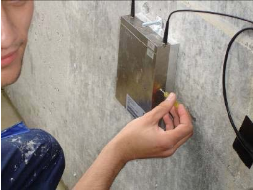
Fig. 2.10 Vis de verrouillage latérales (numéro "3")

Desserrer en dernier les vis de verrouillage latérales marquées du chiffre "3". La procédure est la même que pour les vis précédentes.