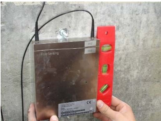
Fig. 2.6 Alignement vertical à l'aide d'un niveau à bulle