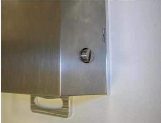
Fig. 2.8 Vis de verrouillage de la masse (numéro "1")

Les vis de verrouillage marquées du chiffre "1" permettent d'immobiliser physiquement la masse oscillante pour le transport.