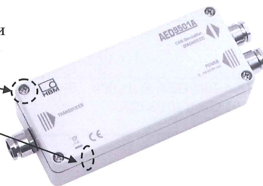
Рисунок 3 – Схема пломбировки от несанкционированного доступа преобразователей AED